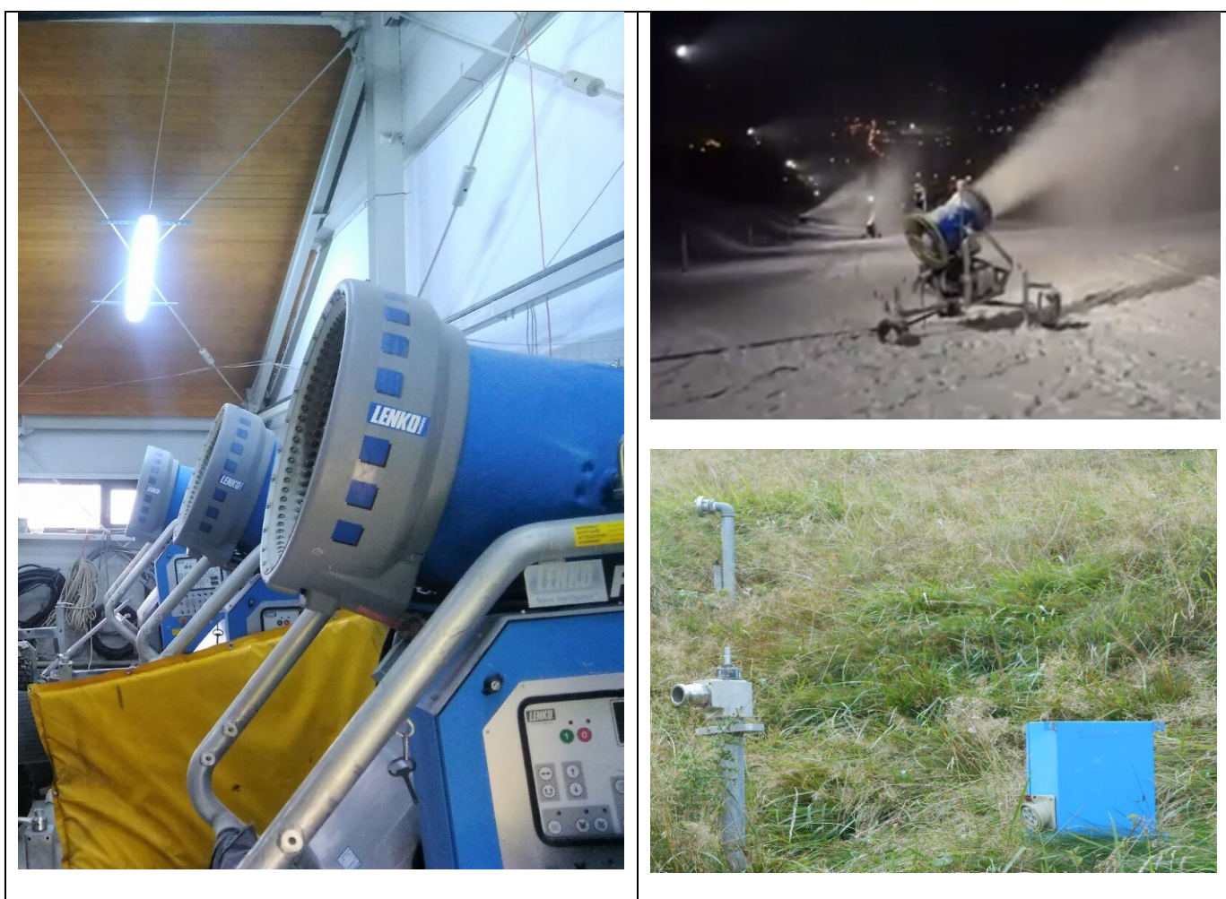
Performante si caracteritici tehnice functionale ale instalatiei

Supravegherea, comanda si controlul intregii instalatii se realizează din camera cu tablourile electrice.