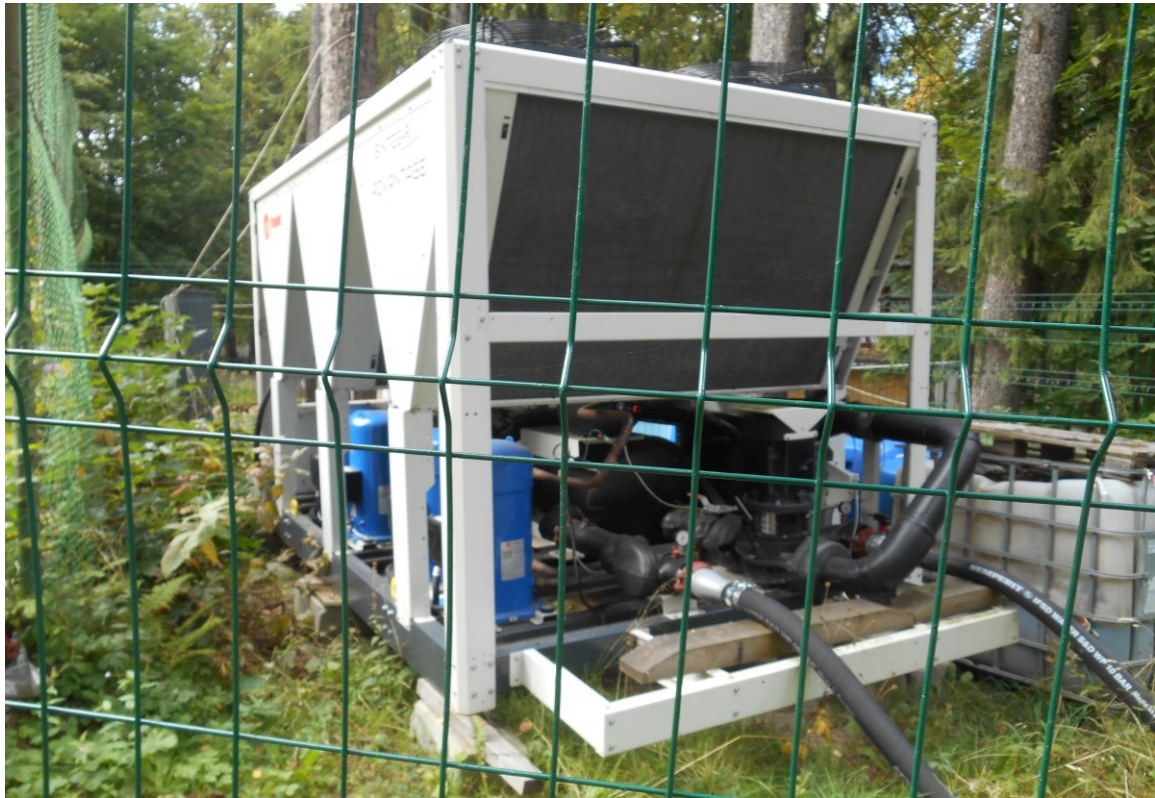
CLADIRE ANEXA PATINOAR